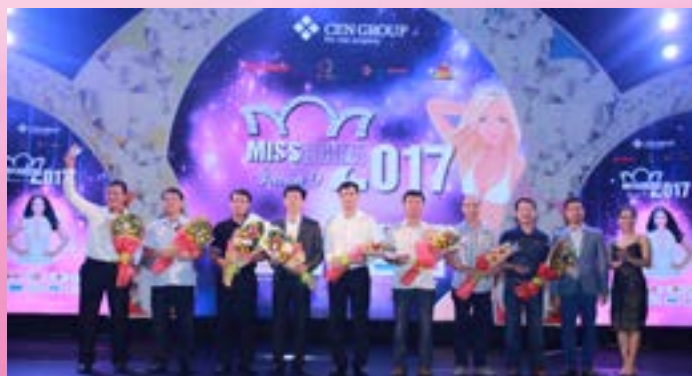
Đội ngũ BGK, nhà tài trợ "khủng" nhất từ trước đến nay.