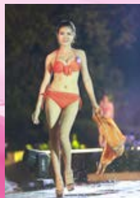
Mãn nhãn với phân trình diễn bikini của những "nàng thơ" nhà CEN