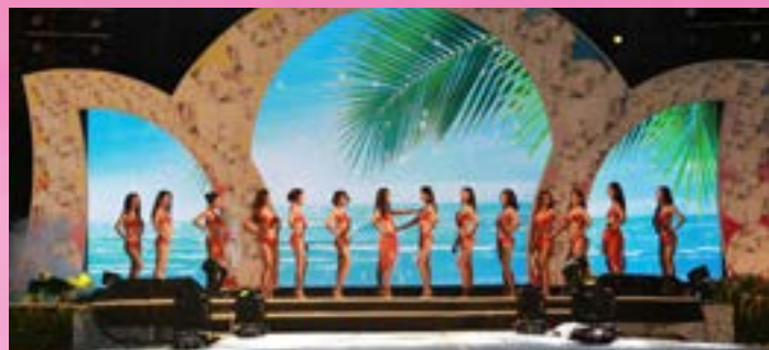
Dàn thí sinh nóng bỏng, quyến rũ với đường cong chết người.