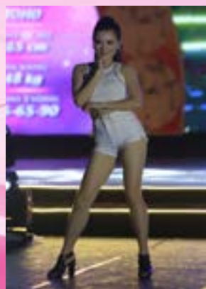
Những tài năng "ngủ quên" nhanh chóng được "khai quật".