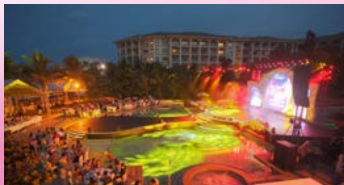
Sân khấu hoành tráng "Ồi! Thật bất ngờ!"

Âm thanh, ánh sáng hoành tráng, chất lượng; thí sinh nóng bỏng, catwalk chuyên nghiệp là những gì chúng ta thấy tại Miss Bikini CENGROUP mùa thứ 9. Và quan trọng hơn hết, tất cả chúng ta – những thành viên của gia đình nhà CEN đã cùng nhau có những giây phút thật "rực rỡ". Hãy cùng chúng tôi nhìn lại những hình ảnh "hoành tráng" về mùa Miss thứ 9 của nhà CEN.